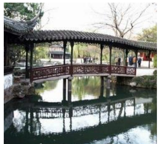
Vrt skromnog administratora