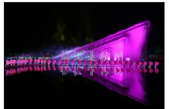
Impression West Lake show