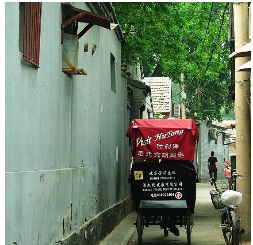
Rikša Hutong tura