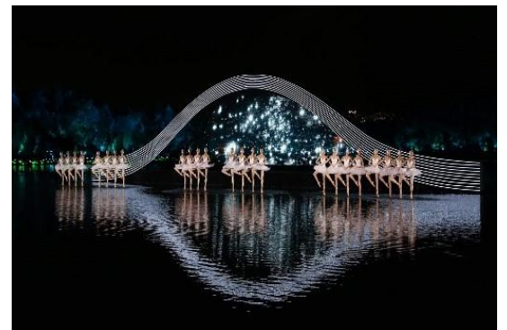
Impression West Lake show