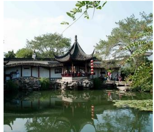
vrt Gospodara mreža

Šetaćemo ulicom Pingjiang , dugom 1606 metara, koja ide paralelno sa rijekom Pingjiang . Tipične kuće starog Suzhou-a, sa bijelim zidovima i crnim crepovima, se mogu vidjeti u ovoj ulici. Malo se toga promijenilo ovdje od Song dinastije , u poslednjih 800 godina. Povratak u hotel, večera, noćenje.